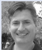
Conradin Cathomen Weltcupsieger Ski Abfahrt '82/83