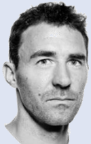
Gian Simmen Olympia Sieger '98 Snowboard Halfpipe